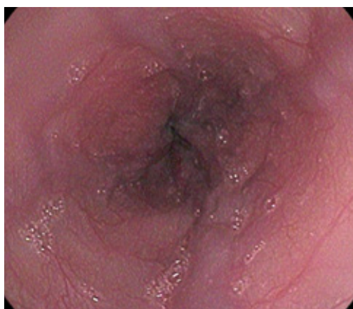
I ст. BPB пищевода, выявлена у 44 (19,1%) больных

Одним из проявлений реакции висцеральной гемодинамики на блокаду системы воротной вены у детей является формирование портосистемных коллатералей, наиболее значимыми из которых представляются варикозно расширенные вены желудка и пищевода, определяющие риск развития пищеводно-желудочных кровотечений. [2, 3, 4, 6, 10, 14]