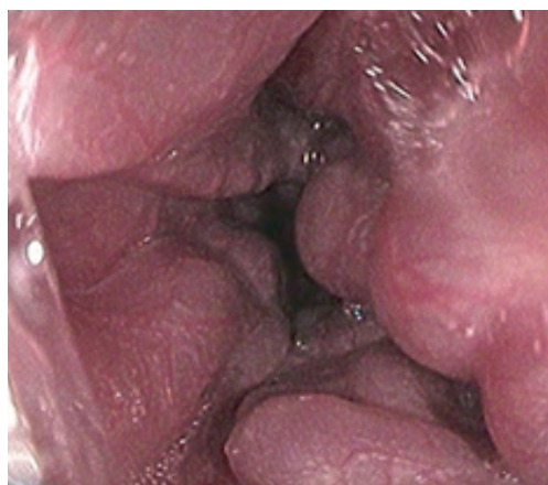
IV ст. BPB пищевода, выявлена у 46 (20 %) больных