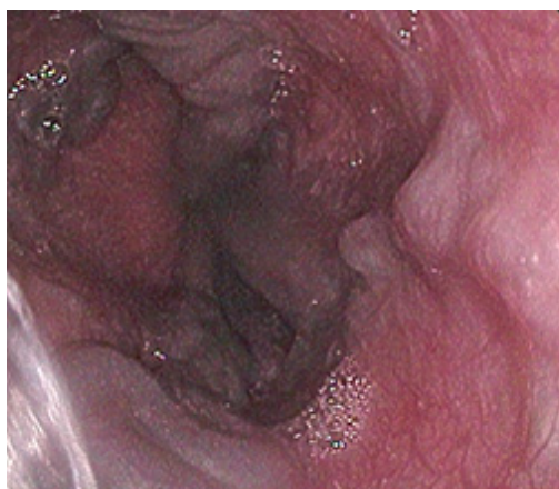
III ст. BPB пищевода, выявлена у 88 (38,3 %) больных