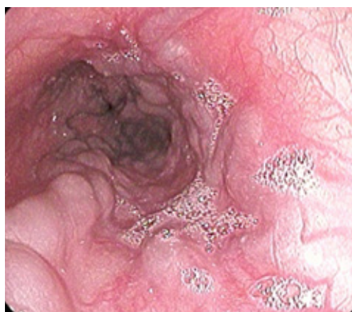
II ст. BPB пищевода, выявлена у 52 (22,6 %) больных